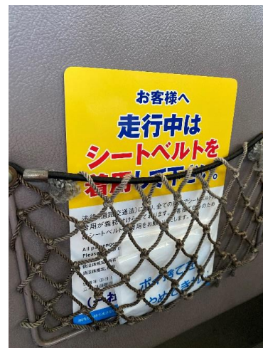
【各座席のポケットへの掲示】