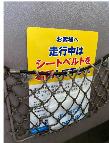
【各座席のポケットへの掲示】